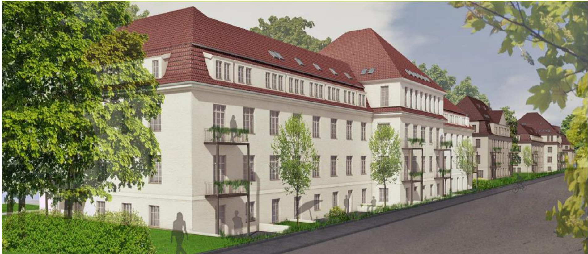
Denkmalsanierung einer ehemaligen Kaserne